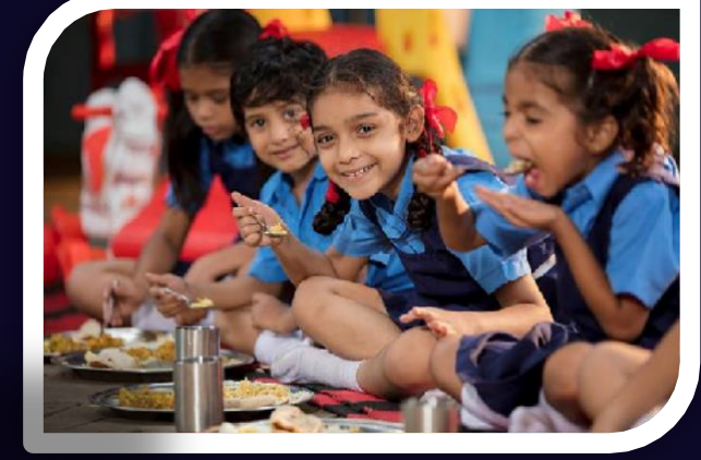
MRDSKS अन्नपूर्णा योजना