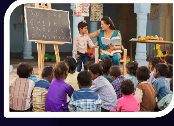
MRDSKS शिक्षा योजना