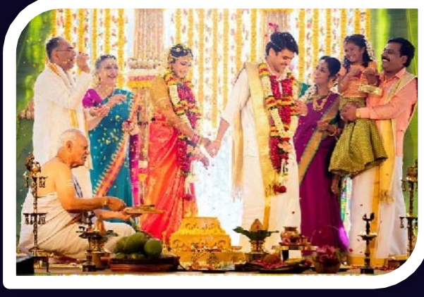
MRDSKS सगुन योजना